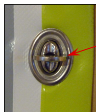
Œillet et tourniquet TITAN