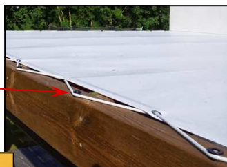
Collier pour maintien sur chevron